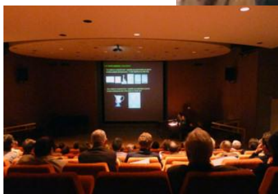
Illustrations des rencontres de l'AFAV de Bruxelles - Namur, Fréjus et Orléans