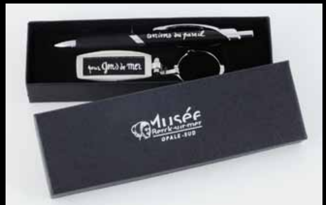
Le coffret stylo pour «gens de mer et terriens du pareil» 8 euros