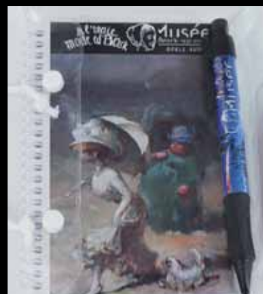
Le carnet et son stylo design 5 euros