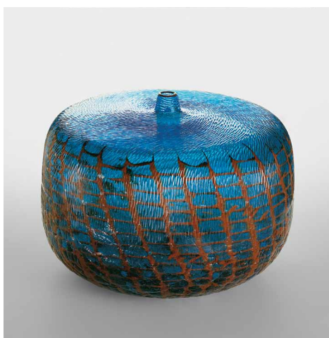
Yoichi Ohira, Vase, Movimento dell'Acqua di Mr. Giacomo , 2002, verre soufflé à décor intercalaire de poudre et de « canes », surface « martelée », collection Privée France