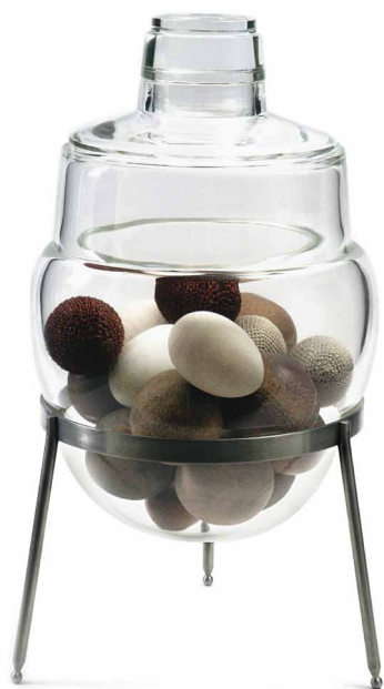
Cristiano Bianchin, Urna Raccoglitrice di Pensiero (Rassembleur de pensées) , 2007, verre soufflé, dépoli et partiellement repoli, bois et fil de chanvre croché, Collection de l'artiste