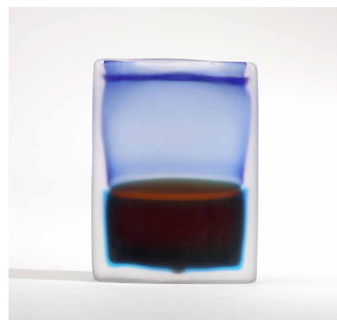
Laura de Santillana, Tokyo-Ga XIV (bleuâtre, rouge foncé) , 2008, verre soufflé moulé à chaud, Collection privée, Etats-Unis