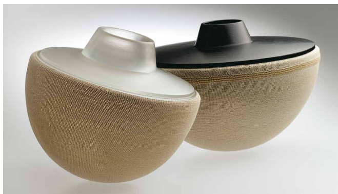
Cristiano Bianchin, Instabili, Contenitori , 2008, verre soufflé dépoli et partiellement « martelé », fil de chanvre croché, Collection de l'artiste

sensuels, expressifs, ces objets, sculptures, vases ou flacons nous montrent des formes inattendues, des matières inédites et des couleurs rares ou étonnantes, mais ils nous confrontent aussi à trois visions de créateurs contemporains, à trois démarches exigeantes, à trois personnalités fortes qui ont choisi le verre comme matériau de prédilection.