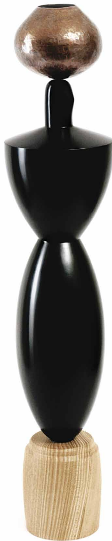
Cristiano Bianchin, Jarre chrysaliforme , 2005, verre soufflé, dépoli et partiellement repoli, surmonté d'un objet trouvé, posé sur un socle de bois d'ornes, Collection de l'artiste