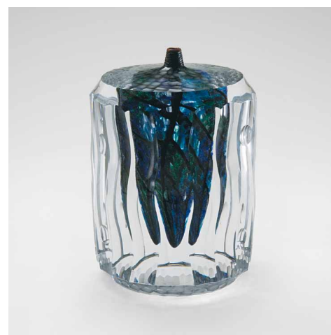
Yoichi Ohira, Vase, Mosaico Sommerso, N° 4 , 2006, verre soufflé à décor intercalaire de murrine et de poudres, surface gravée à la roue « martelée » et « ciselée », Collection Galerie Litvak, Israël