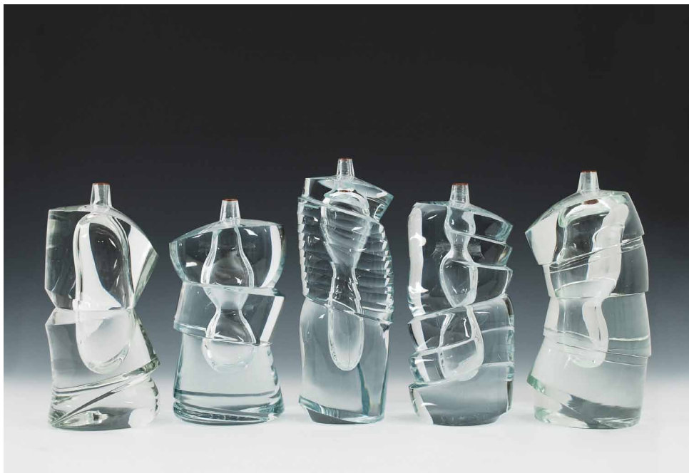
Yoichi Ohira, 5 vases, Cristallo Sommerso Quintet , 2009, verre soufflé, taillé et poli, surface partiellement incisée, Collection de l'artiste

Né au Japon en 1946, Yoichi Ohira reprend, après une formation de design à Tokyo, des études à l'académie des Beaux-arts de Venise où il vit depuis les années 1970. Durant les années 1980 il collabore avec la manufacture De Majo de Murano pour qui il crée des vases et des verres d'une élégance classique. Depuis le début des années 1990, il se consacre exclusivement à la création de pièces uniques en collaboration avec les plus grands maîtres de la tradition vénitienne. Pendant plus d'une décennie, il joue avec des couleurs vives, des polychromies très riches et des matières le plus souvent opaques. Il intègre à son répertoire les effets de matières et de surfaces obtenus par la gravure à la roue, manipule avec brio la technique sophistiquée des « murrines », ouvre parfois des « fenêtres » transparentes dans les surfaces colorées et donne à ses objets de petites dimensions des proportions souvent imposantes. A partir de 2008 il réalise des formes entièrement transparentes, parfois seulement soulignées d'un filet de couleur au col. Massives, monumentales, sculpturales, ces pièces jouent d'un rapport dynamique inédit entre la forme organique de la bulle d'air, vue par transparence, et l'enveloppe extérieure fortement structurée par des surfaces taillées à angles vifs.