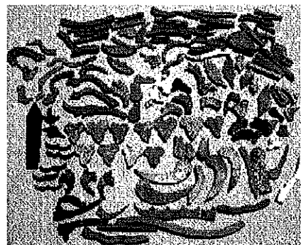
Fig. 2 et 3.- Échantillonnage d'éléments monochromes.

découpée (fig.3). La plupart des éléments sont orangés ou noirs, mais l'on trouve également quelques pièces rouges, vertes et blanches. Une grande plaque bleue (dont la face supérieure, bleu clair, est lisse mais irrégulière et la face inférieure, bleu cobalt, a été polie) est en plusieurs morceaux mais aucune découpe ne semble avoir été faite et aucune petite pièce découpée ne correspond à cette matière bicolore.