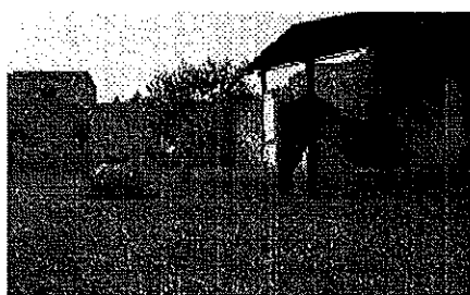
Fig. 1.- Vue du jardin de la Caupona di Euxinus et du petit "pavillon" où on été trouvés les éléments en verre.

Le dépôt de la Casa Bacco à Pompéi conserve un lot de verre plat à vocation ornementale, exhumé lors des fouilles réalisées par la surintendance dans les années 50. Ce lot (Inv. 12149) se compose de plusieurs centaines de fragments de verre opaque vivement coloré, monochrome et polychrome (1). Malgré l'omission des traditionnelles coordonnées de localisation dans la cité, les inventaires du 9 juillet 1958 décrivent assez précisément le lieu de découverte : Taberna del Fenice, nel piccolo ambiente adossato al muro meridionale del giardino, angolo nord - est . Il s'agit d'un petit pavillon adossé au mur du jardin d'une taberna autrement appelée Caupona di Euxinus (Jashemski 1979, vol.2, p. 51-52) situé