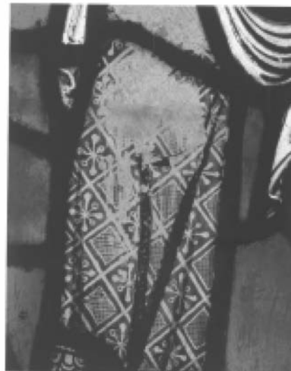
Fig. 3.- Baptême d'un néophyte par un archevêque. Détail du tissu de la dalmatique du diacre. Grisaille brune peinte sur verre jaune. Panneau provenant de la Sainte Chapelle. Musée de Cluny, Paris, XIII e siècle. Blondel 2000, p. 301.

Cette hypothèse est d'autant plus plausible que, comme je le disais en introduction, ces fragments proviennent d'un remblai de démolition composé de silex éclatés et de charbons de bois. Or, ces fragments ne sont pas brûlés ni fondus. Il est probable que la verrière à laquelle ils appartenaient ait été prélevée du bâtiment afin d'en récupérer le plomb. Puis, les vitraux ont été jetés dans la démolition après la lente combustion.