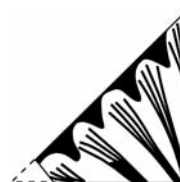
Fig. 2.- Fragment de vitrail à décor de demi-palmette provenant du prieuré de Ganagobie datant du milieu du XI e siècle. Foy 1989, p. 295.

Aucun fragment de plomb n'a été retrouvé sur le site. Il n'est donc pas possible de déterminer le mode de fixation de ces fragments de verre plat. Néanmoins, la taille au grugeoir montre qu'il est probable que ces fragments aient été insérés dans une résille de plomb afin de les fixer. Il est possible que le plomb ait été récupéré afin d'être réutilisé.