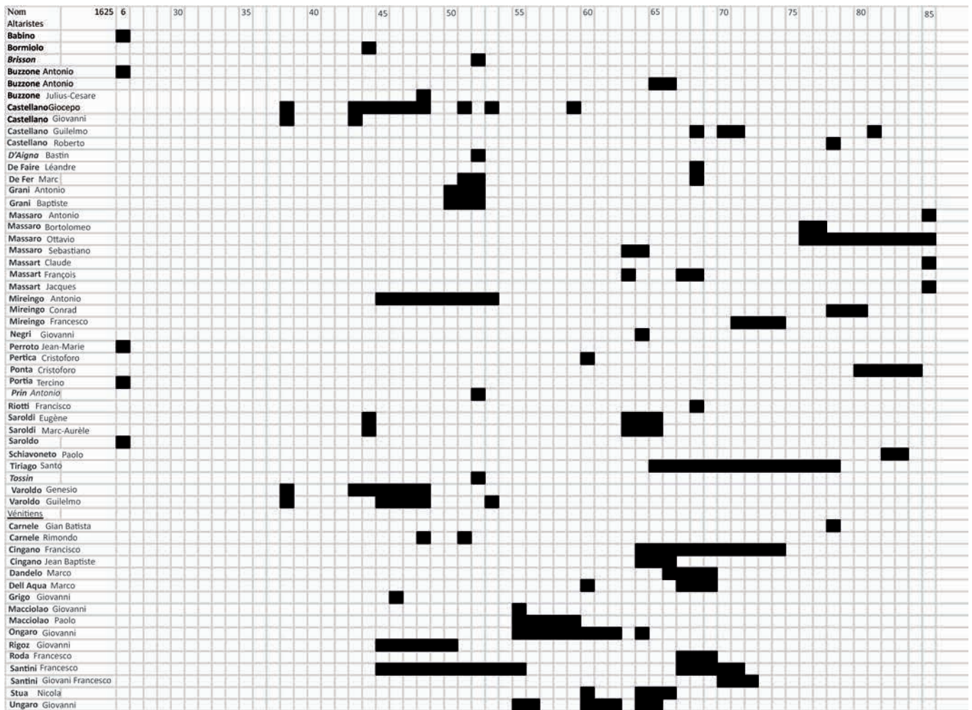
Fig. 2.- Traces attestées des verriers altarais et vénitiens à Liège, Maastricht, Bois-le-Duc et Bruxelles, de 1626 à 1687.