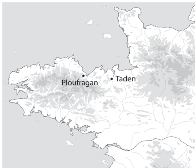
Fig. 1.- Localisation des sites de Taden et de Ploufragan (Côtes d'Armor) ; DAO L. Simon / Inrap.

La villa de Ploufragan, quant à elle, succéderait à une ferme à enclos fossoyé créée au cours de La Tène finale, qui n'a été que partiellement appréhendée. Après une phase de restructuration parcellaire du secteur, liée à l'installation d'une nouvelle ferme, est édifiée une villa avec cour centrale, vraisemblablement au cours de la deuxième moitié du II e s. Elle connaît plusieurs étapes d'évolution architecturale, perdurant au moins jusqu'au III e s., voire au IV e s.