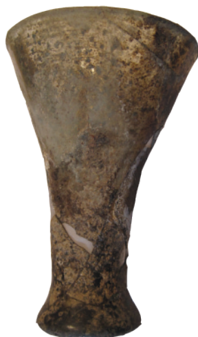
Fig. 1 Vases du cimetière de Saillans (Drôme)