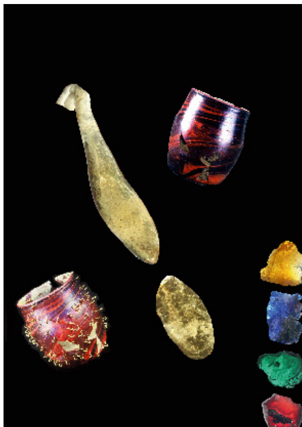
Gobelet carolingien en verre rouge marbrée avant et après restauration. Fragments industriels de rebuts de cuisson de couleur des fours Legras.